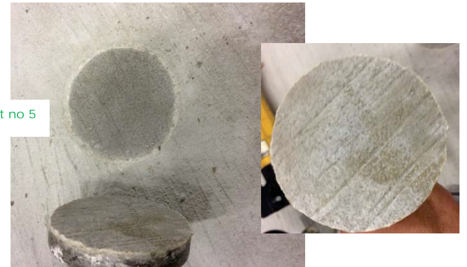
Dalle test no 5