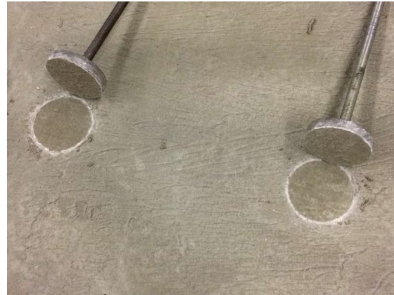
Dalle test no 3